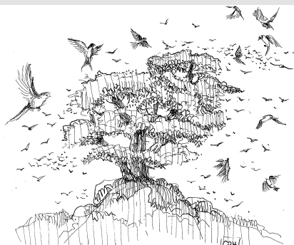
Le cèdre du livre d'Ezékiel (1 o lecture)