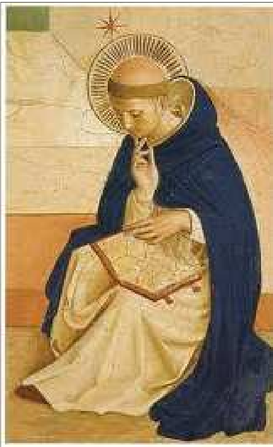
Fra Angelico, Thérèse de Lisieux, bienheureux, sainte et artistes : Trois raisons de leur offrir notre année !

Lundi 1 er octobre 2012 de 20 h 30 à 22 h Au Carmel de Frileuse 2, route du Carmel - D.131 à BRIIS SOUS FORGES