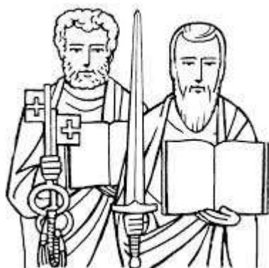
Saint Pierre et Saint Paul

Saint Pierre et Saint Paul ont subi le martyre à Rome, sans doute en l'an 64 pour Pierre et l'an 67 pour Paul.