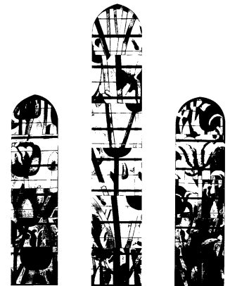
Nouveaux vitraux - St Sulpice (Varenes)

Salle André Malraux - YERRES Rue Basse (près du cinéma Paradiso)